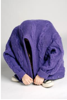
Fotografie: sitzen Lena Konz Beschützt Aus der Serie „Besitz“ Pigment-Inkjetdruck, 66 x 100 cm