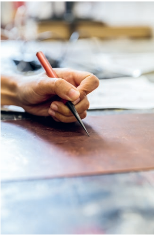
Gravieren mit Radiernadel auf einer Kupferplatte Engraving with an etching needle on a copper plate