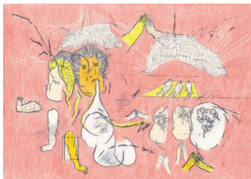
Episodic memory – gods food