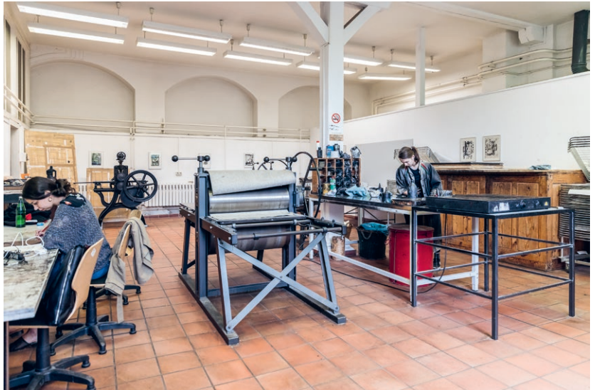
Radierwerkstatt im Westflügel am Campus Kunst Etching workshop in the west wing on the Art campus