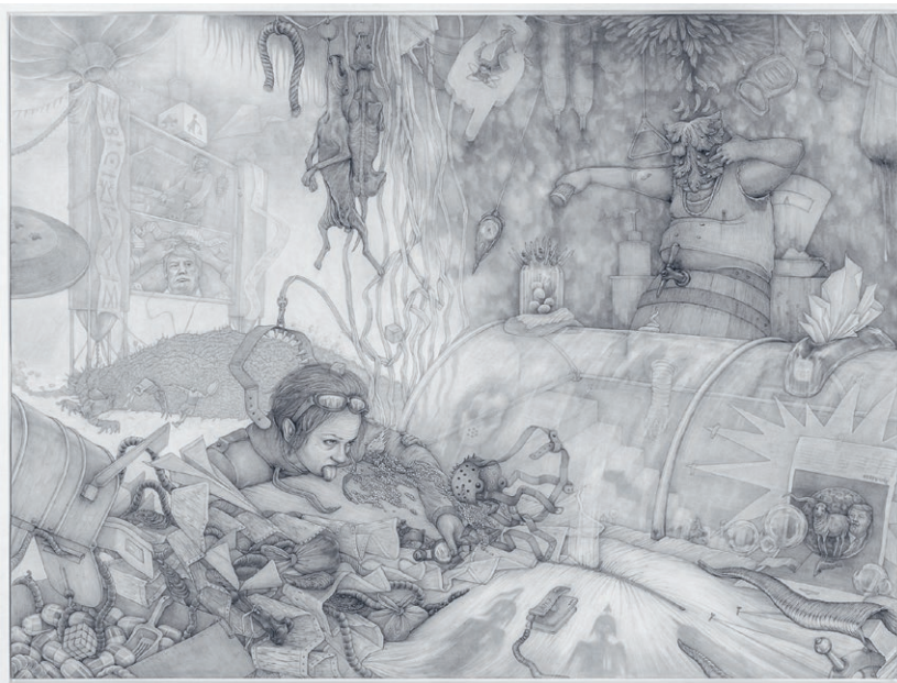
Die Brieftaube Carrier Pigeon